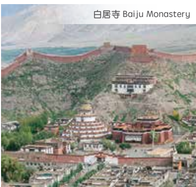
白居寺 Baiju Monastery