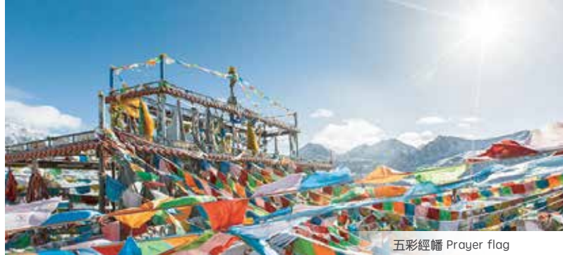
五彩經幡 Prayer flag