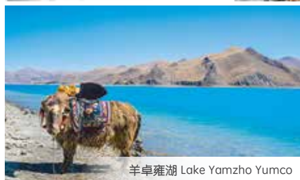
羊卓雍湖 Lake Yamzho Yumco