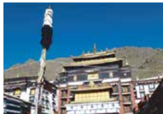
紮什倫布寺 Tashilhunpo Monastery