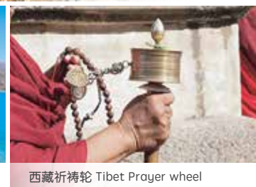
西藏祈禱輪 Tibet Prayer wheel