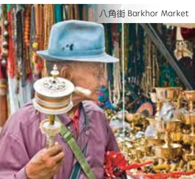
八角街 Barkhor Market

機票: 機場稅 AUD$300(報名時支付)Taxes, fuel surcharges, port charges AUD$300 (pre-paid in AUS) 小費: 司機+導遊服務費 AUD$150/大小同價(報名時支付) Tour guide & driver service fees AUD$150 (pre-paid in AUS) 其他: 簽證+旅遊保險(強烈建議購買) Visa + Travel insurance (recommended)