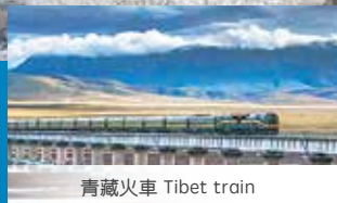
青藏火車 Tibet train