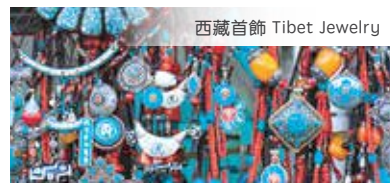
西藏首飾 Tibet Jewelry