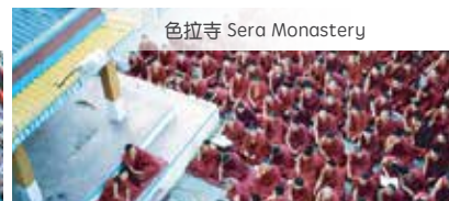
色拉寺 Sera Monastery