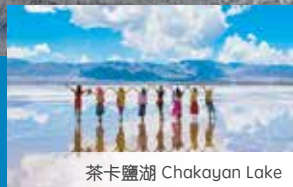
茶卡鹽湖 Chakayan Lake

✨ 團費含機票+青藏火車 Tour Fee Include flights + Tibet train fr $ AUD 3699 + $300 稅